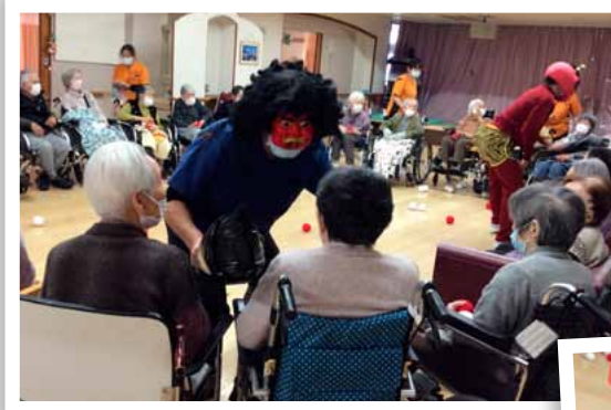
入所フロアの鬼退治 赤鬼と青鬼登場！