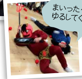
まいった～ ゆるしてくれえ…