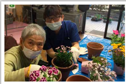
寄せ植え鉢を作りました。春ですね～