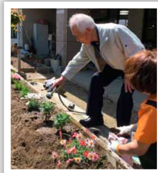
花壇にもお花を植えました。