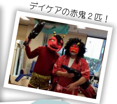
デイケアの赤鬼2匹！